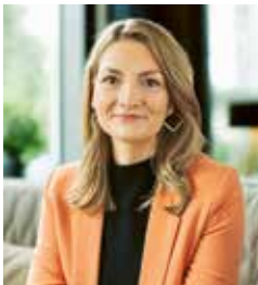
Judith Gerlach, Bayerische Staatsministerin für Gesundheit, Pflege und Prävention.

Weltweit beobachten wir Veränderungen durch den Klimawandel und eine steigende Belastung auf die Gesundheit. Die Expositionswege sind dabei sehr vielfältig und reichen von extremen Wetterereignissen, zunehmendem Hitzestress, abnehmender Luftqualität und Wasserquantität bis zur Verbreitung neuer Vektoren.