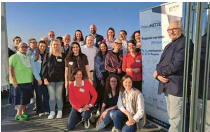
Bereits zum achten Mal konnte die KVB zu ihrem Praxisworkshop einladen.