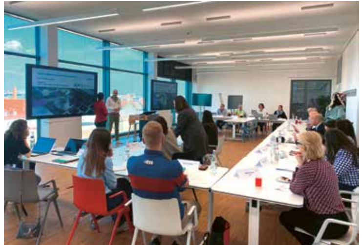
Wer löst Probleme auf welche Weise? Die einzelnen Netze teilen ihre Lösungsansätze mit ihren Kolleginnen und Kollegen.