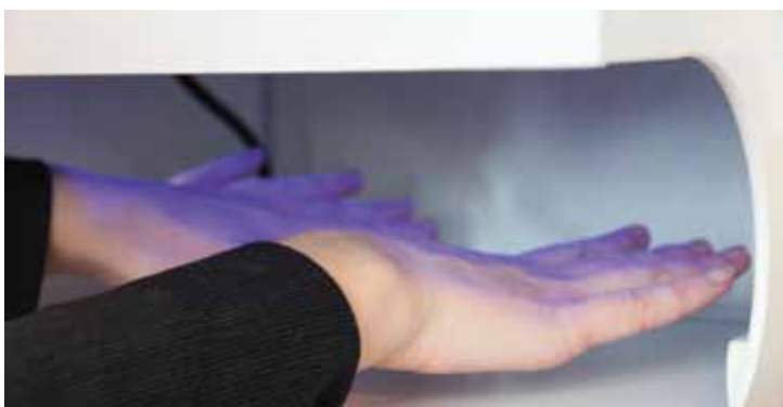
Nach der Händedesinfektion: Betrachtung unter UV-Licht zur Darstellung von Benetzungslücken