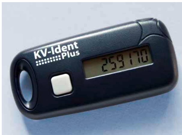
Der KV-Ident Plus Token sorgt für ein Plus an Sicherheit.